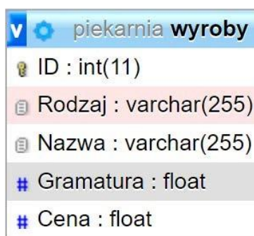
Ilustracja 1. Baza danych

Baza danych zawiera jedną tabelę przedstawioną na ilustracji 1. Tabela wyroby zawiera informacje o pogrupowanych wyrobach oferowanych przez zakład piekarski. W tabeli znajdują się pola z rodzajami wyrobów, ich nazwy, gramatury oraz ceny produktów.